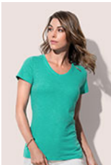
ST9510 Sharon Slub V-neck