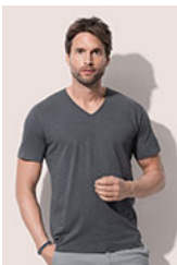
ST9410 Shawn Slub V-neck